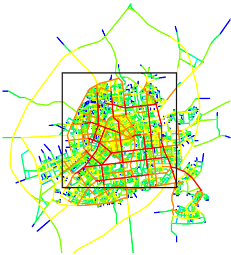
A 长春市现状空间可达性